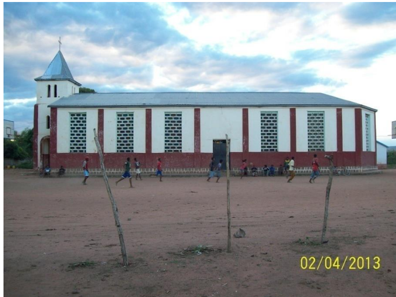
Eglise Très Sainte Trinité, Ambohimiarina, à coté du collège