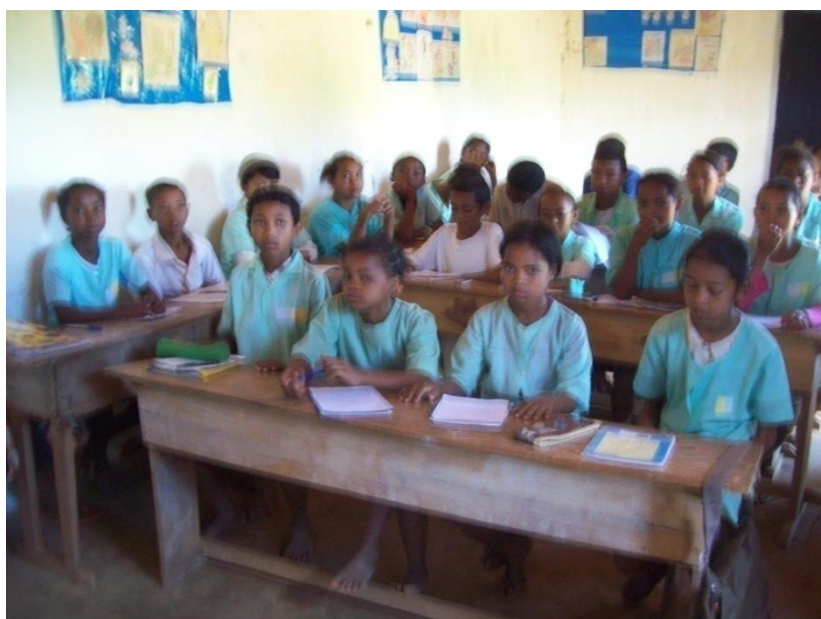
Les élèves de la classe de 5 ème