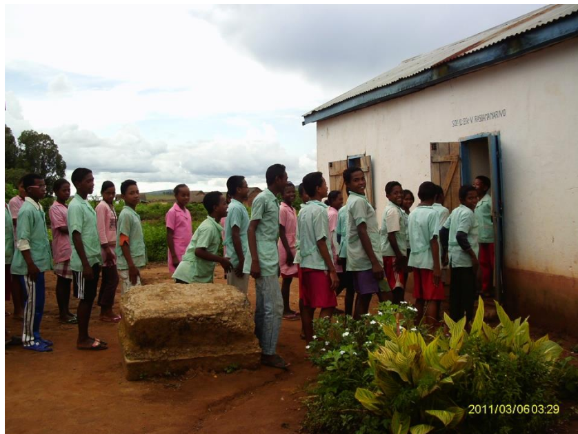
Les élèves à la rentrée de récréation.