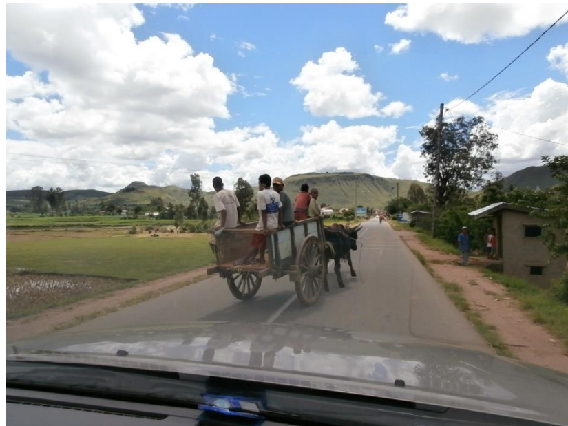
Route Nationale n° 1 qui relie Antananarivo la Capitale et Tsiroanomandidy