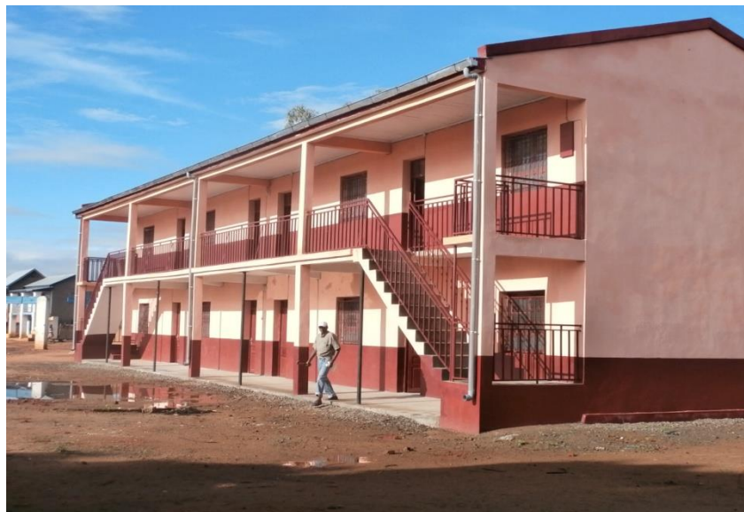
Vue du profil