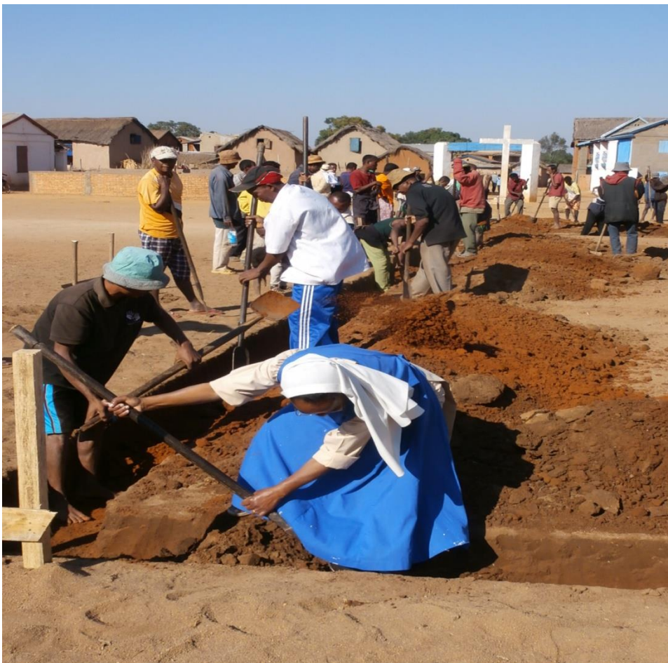
Les Sœurs participent aussi aux travaux.