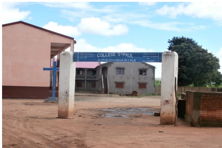
Entrée du Collège