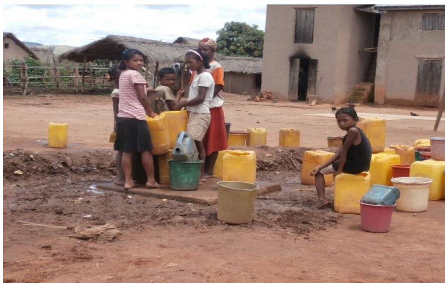
Borne fontaine populaire pour l'eau potable, ouverte une fois par jour, souvent le matin.