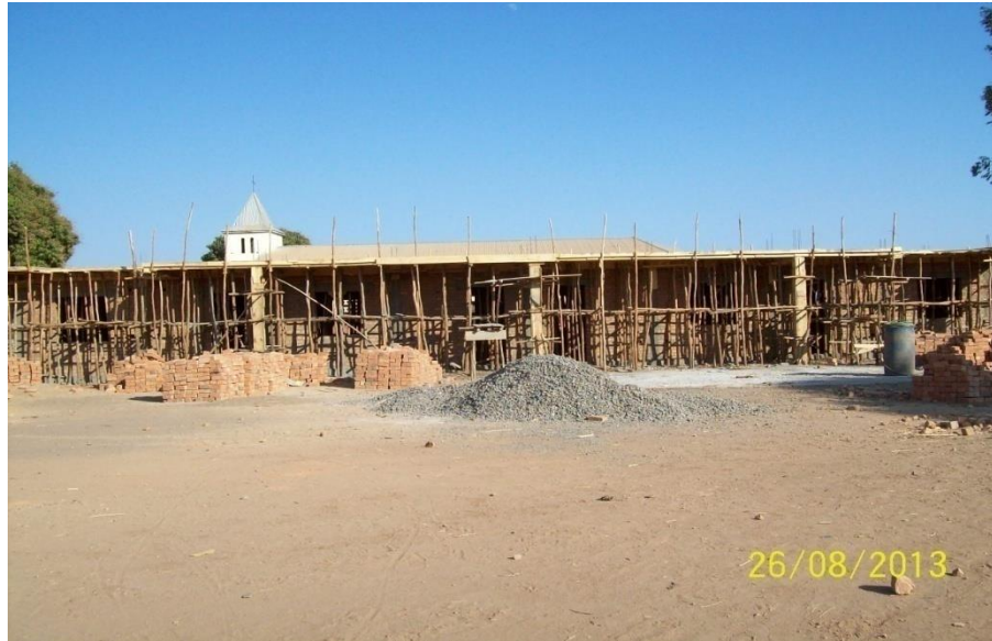
Finition du rez-de-chaussée