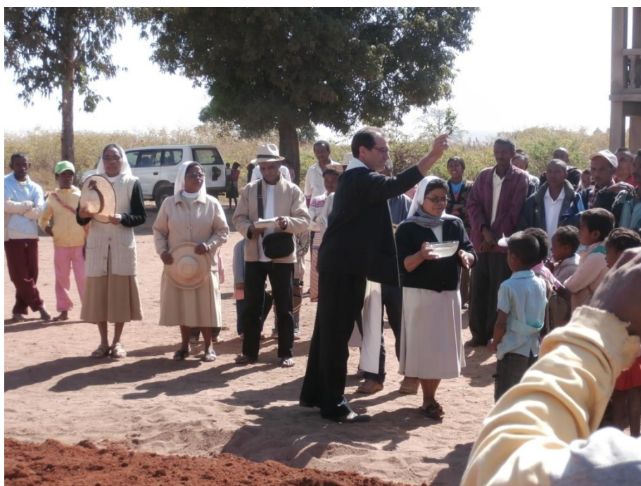
Son Excellence Mgr Gustavo Espino Bonbin, Évêque du Diocèse de Tsiroanomandidy, bénit la nouvelle construction qui va débiter.