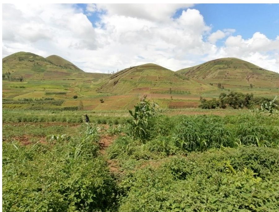
Culture de maïs, manioc et arachides. On cultive même les pieds des montagnes.