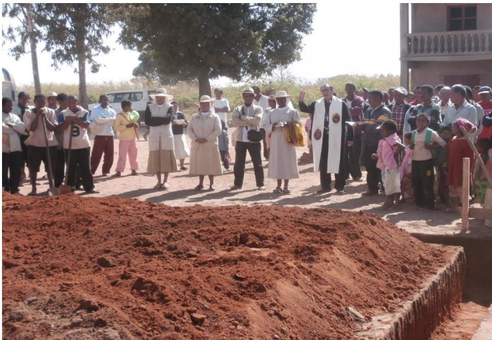
C'était le 6 juin 2013, jour de la fête du Sacré-Cœur.