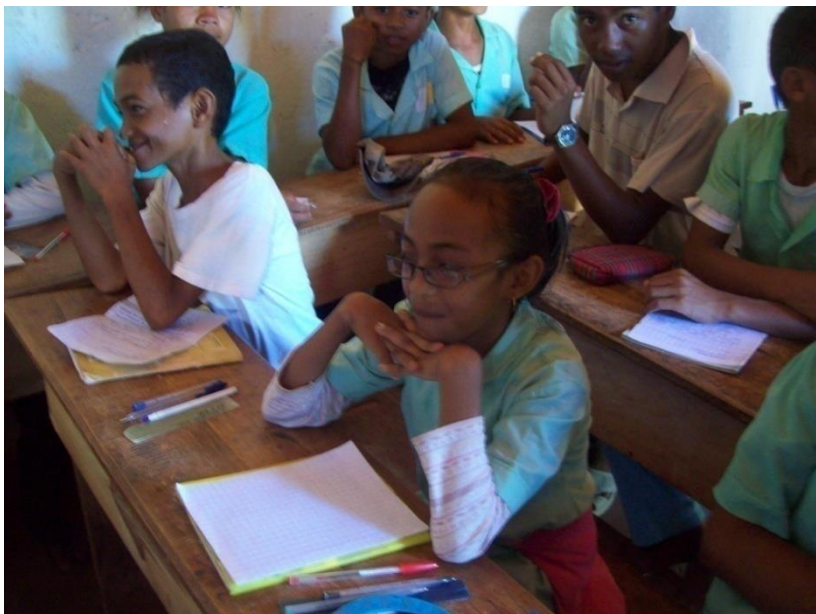
Les élèves de la classe de 4 ème