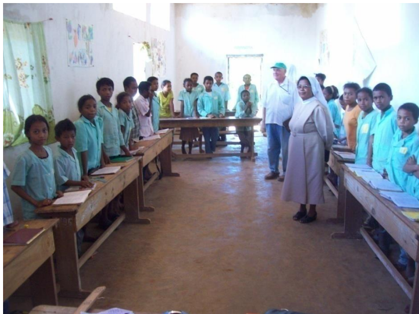
Les élèves de la classe de 6 ème