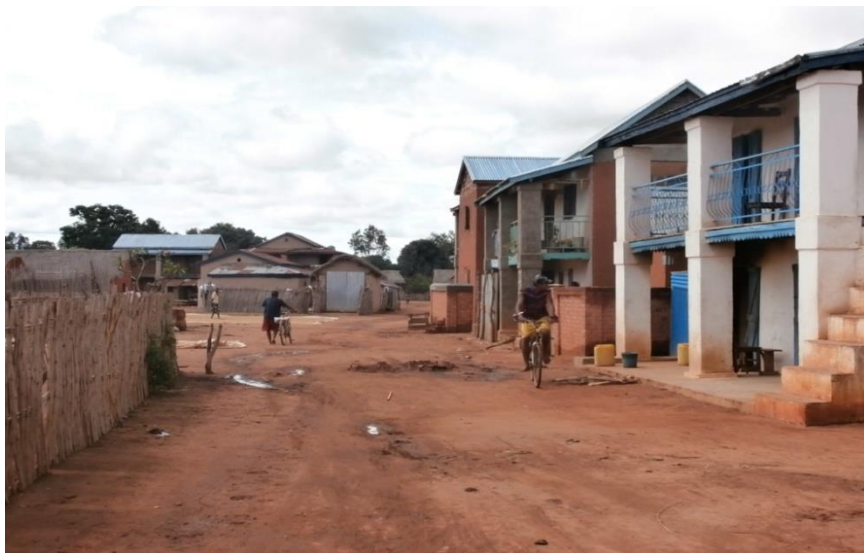
La route principale du village. Celle-ci continue jusqu'au Collège