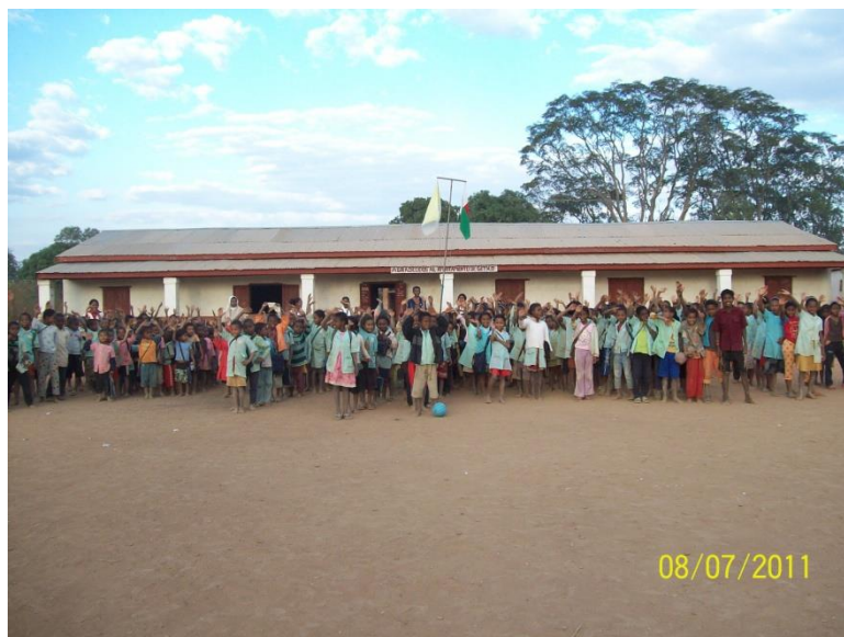
Bâtiment pour les classes primaires et maternelles