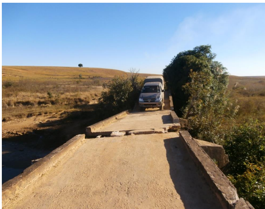
Pour éviter la charge de la voiture, tous les voyageurs doivent descendre.