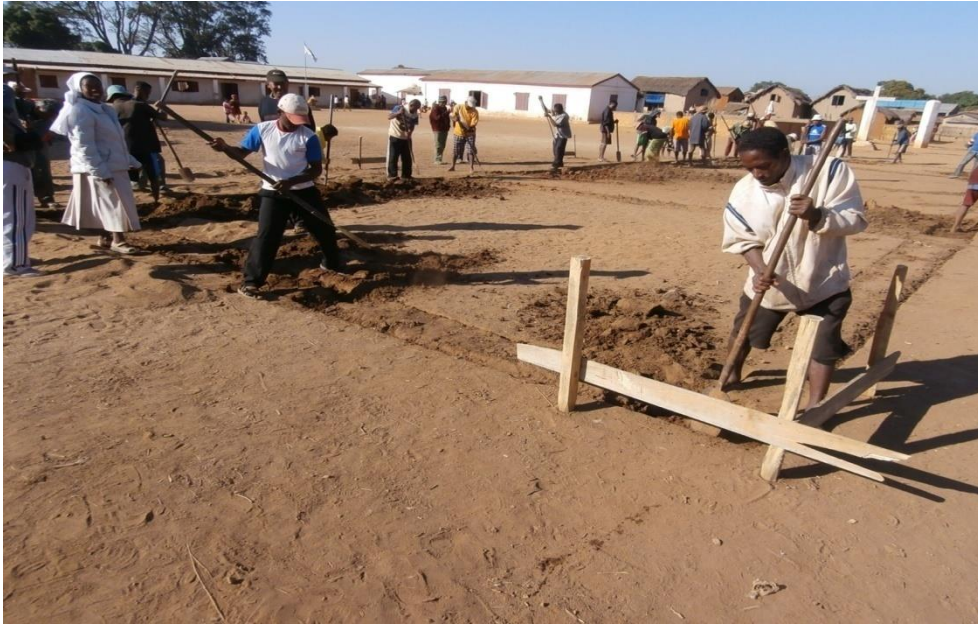
Commencement du creu de la fondation : parents d'élèves, chrétiens, gens du village et éducateurs collaborent pour creuser la fondation.