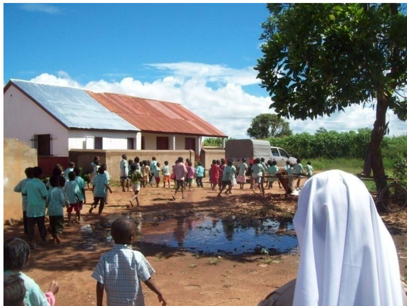
Les Sœurs sont arrivées à Ambohimiarina en 2010 et habitent ici.