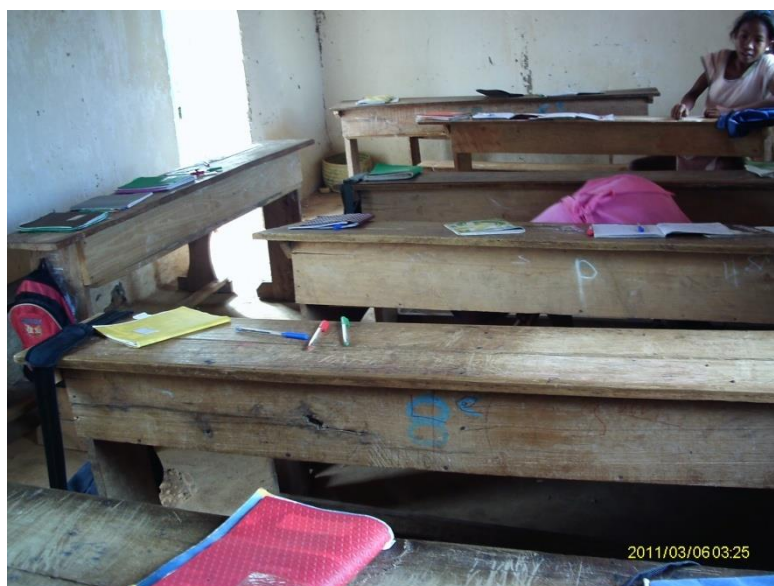
Les salles sont trop serrées.