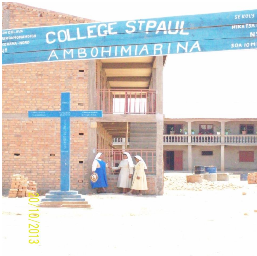
Vue d'ensemble dès l'entrée de l'enceinte du Collège