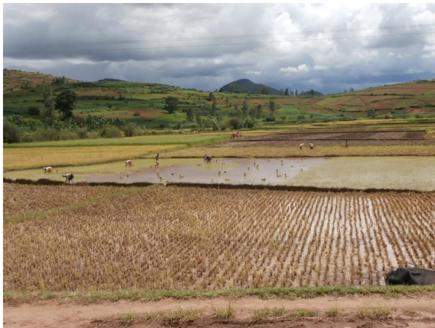
La riziculture, activité principale de la Région.