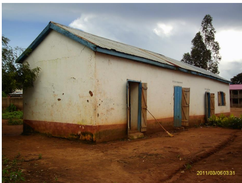
Le bâtiment des classes secondaires