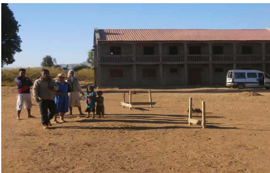
Piquetage du terrain