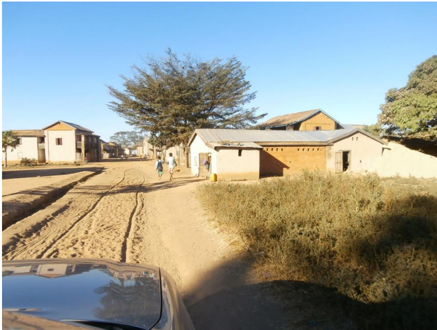
Le village en période sèche