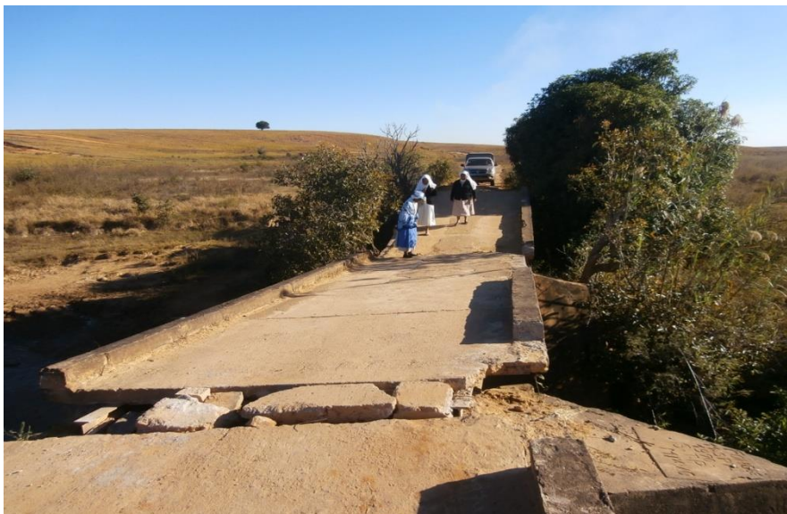
Pont avant d'entrer dans le village. Ce pont est dangereux mais on doit y passer.